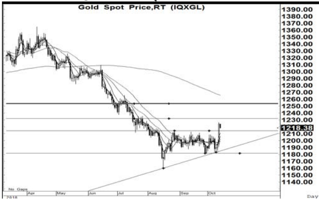
กราฟราคาทองคำ Spot ปิดวันที่ 11 ตุลาคม 2561 ปิดที่ 1224.6

ภาวะตลาดทองคำโลก วานนี้ต้งฟื้นขึ้นแรง จากทิศทางดอลลาร์สหรัฐอ่อนค่าลง โดยล่าสุดดัชนีดอลลาร์มาอยู่ที่ 95.04 หลังจากตลาดหุ้นสหรัฐยังคงปรับลดลงแรงเป็นวันที่สองติดต่อกัน โดยนักลงทุนยังคงกังวลต่อสงครามการค้าจะส่งผลกระทบต่อผลประกอบการของบริษัทจดทะเบียน หลังจากประธานาธิบดีสหรัฐนายโดนัลด์ ทรัมป์เมื่อวันพุธที่ผ่านมา ยังคงจะเรียกเก็บภาษีนำเข้าจากจีนอีก 2.67 แสนล้านดอลลาร์ หากจีนทำการตอบโต้สหรัฐ นอกจากนี้ผู้อำนวยการ IMF นางคริสทีน ลาการ์ด เปิดเผยว่าการตั้งเครียดทางการค้าจะกระตุ้นการเติบโตของเศรษฐกิจโลกและจะส่งผลกระทบต่อประเทศที่ไม่เกี่ยวข้องได้รับผลกระทบด้วย ขณะที่อัตราผลตอบแทนพันธบัตรรัฐบาลสหรัฐอายุ 10 ปีลดลงสู่ระดับ 3.157% ด้านทิศทางด้านค่าเงินบาท/ดอลลาร์สหรัฐกลับมาแข็งค่าขึ้น ล่าสุด 32.68 บาท/ดอลลาร์สหรัฐ ส่งผลให้ทิศทางราคาทองคำในประเทศขึ้นดีกว่าทิศทางราคาทองคำโลก